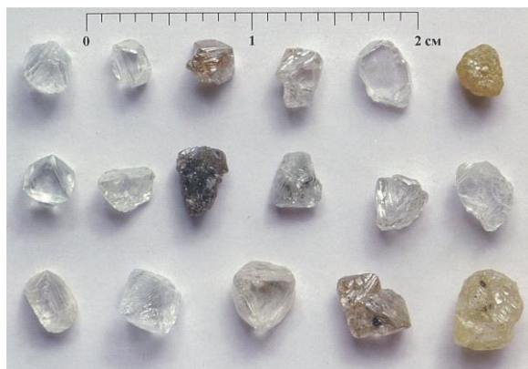
Рис. 4. Алмазы из кимберлитов трубки Айхал (Далдыно-Алакитский алмазоносный район)

более 50%). Следует отметить, что каждая из этих трубок индивидуальна по типоморфным особенностям алмазов. Из других черт следует выделить высокое содержание двойников и сростков, а также поликристаллических агрегатов, преобладание кристаллов с сине-голубой, реже с зеленой фотолюминесценцией.