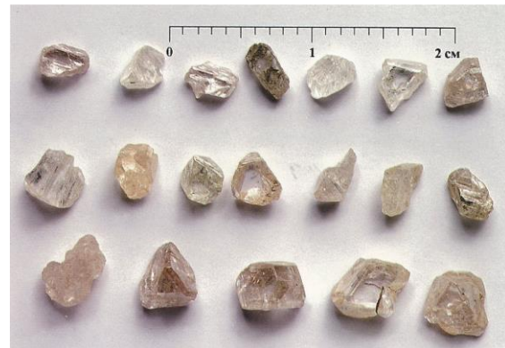
Рис. 3. Алмазы из кимберлитов трубки Нюрбинская (Средне-Мархинский алмазоносный район)

морфных особенностей, присущих богатым диатремам (рис. 3), с преобладанием кристаллов октаэдрического (О), переходного (ОД) и ромбододекаэдрического (Д) (их соотношением О:ОД:Д=1:1:1) габитусов, при отсутствии типичных округлых алмазов, и заметным (до 5%) содержанием кристаллов псевдоромбододекаэдрического габитуса, сложенных тригональными слоями роста «мархинского» типа. Кимберлитовые диатремы этого поля характеризуются также присутствием в небольшом (около 5%) количестве алмазов с тонкой окрашенной оболочкой 1V разновидности и низким содержанием двойников и сростков, превалированием индивидов с розово-сиреневой фотолюминесценцией, с высоким содержанием примесного азота в форме А-центра. Большинство встреченных сингенетических включений представлены минералами-узниками ультраосновной ассоциации.