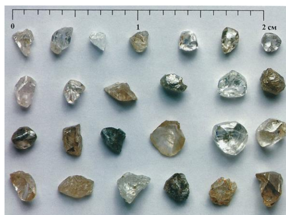
Рис. 5. Алмазы из кимберлитов трубки Заполярная (Верхнемунское поле)

Алмазы из кимберлитовых тел Верхнемунского поля по своим типоморфным особенностям занимают обособленное положение в пределах рассматриваемой субпровинции. Они характеризуются морфологическим спектром кристаллов с преобладанием додекаэдроидов с шагренью и полосами пластической деформации, которые присутствуют в кимберлитовых телах с убогой алмазоносностью. Это находится в противоречии с их сравнительно высокой (полупромышленной) алмазоносностью, достигающей в некоторых трубках (Заполярная) промышленных концентраций (рис. 5), т.е., с одной сторо-