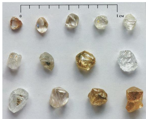
Рис. 1. Алмазы из кимберлитов трубки Таёжная (Малоботубинский алмазоносный район)

Во второй группе отмечается (рис. 1) примерно равное соотношение кристаллов октаэдрического и ромбододекаэдрического габитусов при сравнительно низком (первые проценты) содержании