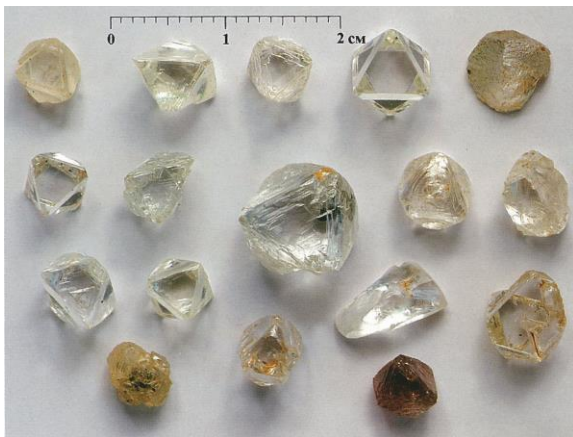
Рис. 2. Алмазы из кимберлитов трубки Мир (Малоботуобинский алмазоносный район)

Третья , наиболее высокопродуктивная группа кимберлитовых тел характеризуется преобладанием груболаминарных кристаллов октаэдрического (рис. 2) и переходного от него к ромбододекаэдрическому габитусов при низком (менее 10%) содержании индивидов ромбододекаэдрического габитуса, среди которых практически отсутствуют типичные округлые алмазы.