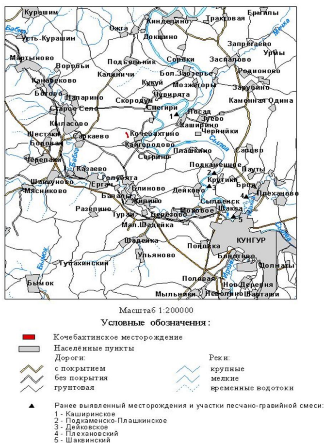
Рис. 1. Обзорная карта района работ (Цифровая модель ПГГСП «Геокарта». Масштаб 1:500000, 2005 г.)

Сопоставление качества природной песчано-гравийной смеси с требованиями ГОСТ 23735-2014, ГОСТ 25607-2009, ГОСТ 8736-2014 приведено в табл. 1.